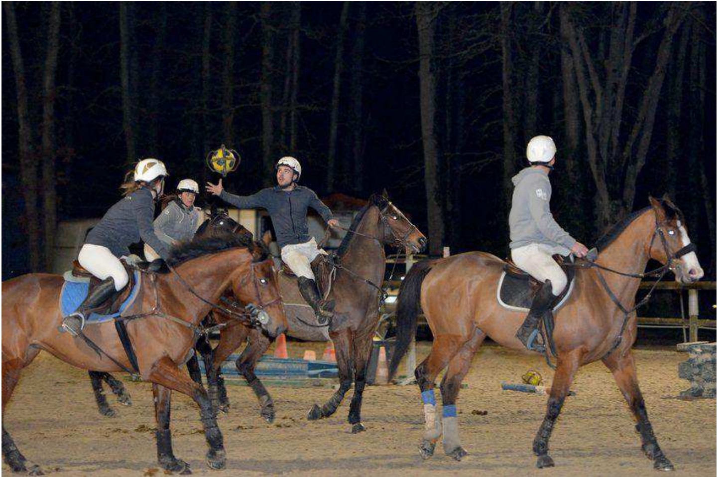
L'équipe de horse-ball du Sabot d'or lors d'un entraînement.

Le horse-ball est né en France en 1979. Yves Burban, à la tête du centre équestre Le Sabot d'or à Saint-Nazaire, mène alors une équipe au plus haut niveau. Aujourd'hui, c'est son fils Pol qui relance cette discipline sportive dans le club.