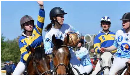
Le royaume des sports co à cheval