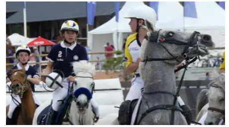
Le horse-ball en vedette