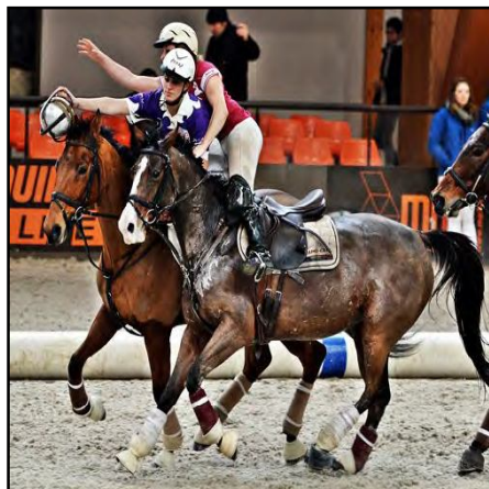
Chambéry face à Montpellier Vallon

Le Grand Parquet de Fontainebleau, les 8 meilleures équipes féminines, des enjeux sportifs... tous les ingrédients étaient réunis pour assister à un grand week-end de horse ball féminin lors de cette étape du championnat de France.