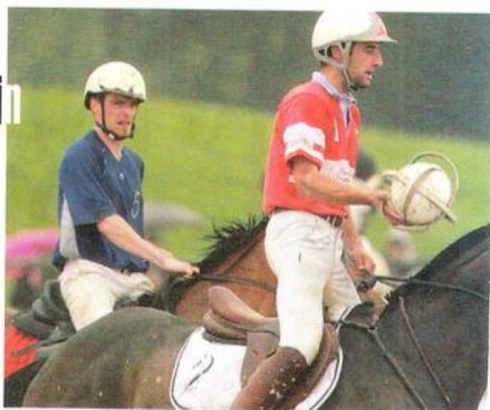
Les Bordelais en rouge lors de leur dernier match contre Angers.